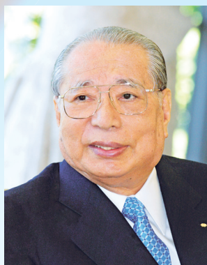
Dr. Daisaku Ikeda, presidente da SGI

Foi há quase cem anos que o Sr. Matsushita começou seus negócios numa oficina junto com sua esposa e seu cunhado. Essa oficina que gradualmente se tornou a Panasonic, uma das empresas mais conhecidas internacionalmente, fabrica os mais diversos tipos de produtos eletrônicos que fazem parte de nosso dia a dia: televisões, máquinas de lavar, entre outros. Hoje, 250 mil pessoas trabalham nessa multinacional, que também fabrica computadores e as baterias mais duráveis do mundo.